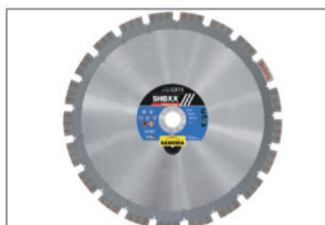
SHOXX GX13 Silencio* s. Seite 52

*SILENCIO: = deutliche Lärmreduzierung um ca. 80% gegenüber Massivkern in Standardausführung.